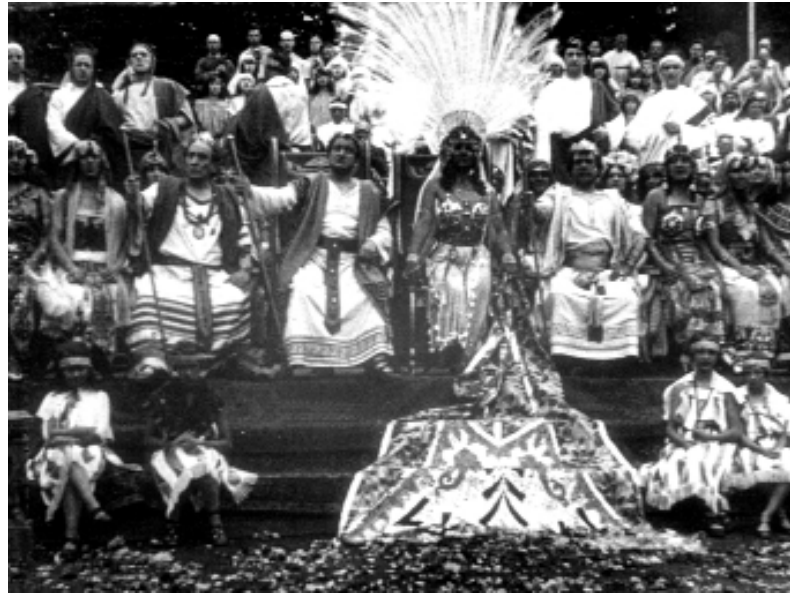
Feest Olympisch Stadion, 17 augustus 1924 (SA-FILM 47)

Archieven, audiovisuele werken, geluidswerken en het auteursrecht