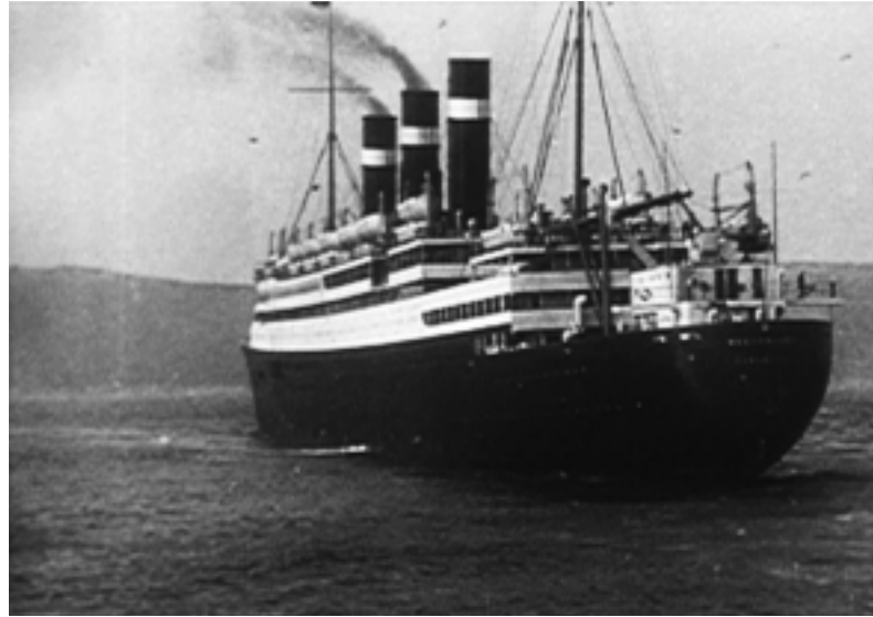
De Belgenland, Red Star Line, 1923 (SA-FILM 79)