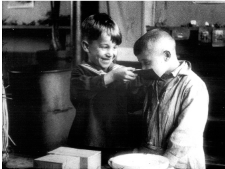
School in de Keistraat, 1926 (SA-FILM 121)